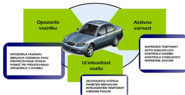
Slika 1: Aktivna varnost

Slika, diagram oziroma graf naj bodo na isti strani kot oznaka in vir, če ni prostora, prestavimo vse skupaj na novo/naslednjo stran.