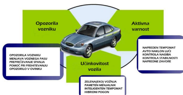
Slika 1: Aktivna varnost

Slika, diagram oziroma graf naj bodo na isti strani kot oznaka in vir, če ni prostora, predstavimo vse skupaj na novo/naslednjo stran.